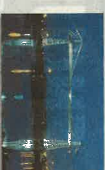
NEWPORT Puente Newport de Beldarrain Por el grupo y con la ayuda española. 1959