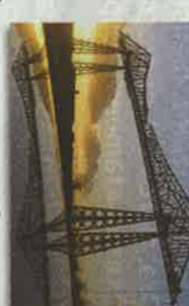
MIDDELBURG Puente Middelburg de Beldarrain Por el grupo y con la ayuda española. 1959