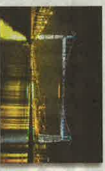
BIZKAIN Puente Bizkain - Vitoria-Gasteiz Por el grupo y con la ayuda española. 1959