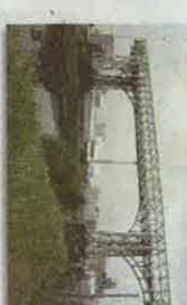
WARRINGTON Puente Warrington de Beldarrain Por el grupo y con la ayuda española. 1959