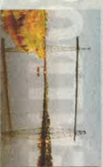
ROCHEFORT Puente Rochefort de Beldarrain Por el grupo y con la ayuda española. 1959