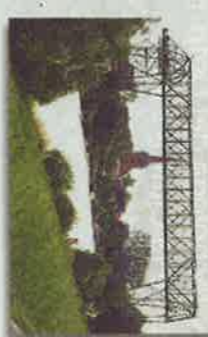
OSTIEN Puente Ostien de Oñate Por el grupo y con la ayuda española. 1959