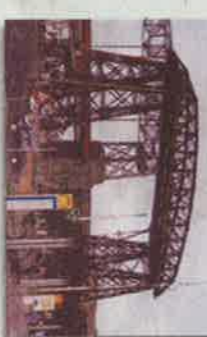
LA BOKA Puente La Boka de Beldarrain Por el grupo y con la ayuda española. 1959